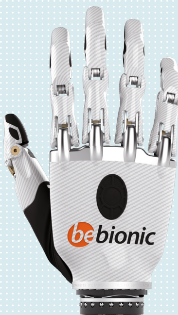
► Small white/malá, bílá