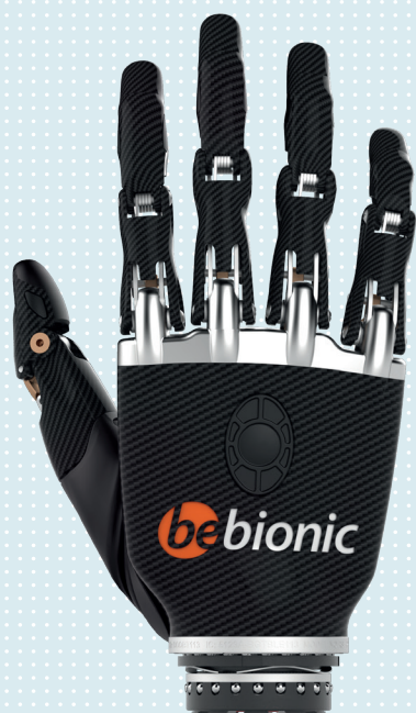
► Small black/malá, černá